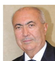
S.E. Don Fouad Makhzoumi Independiente, Presidente del Partido de Diálogo Nacional