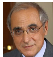
S.E. Don Henri Helou Independiente, aliado con el Bloque Del Encuentro Democrático