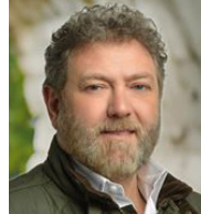
S.E. Don Neemat Frem Independiente, aliado con el Bloque Líbano Fuerte