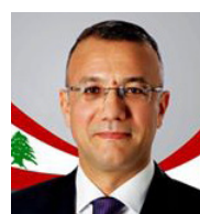
S.E. Don Ali Darwish Independiente, aliado con el Bloque del Centro Independiente